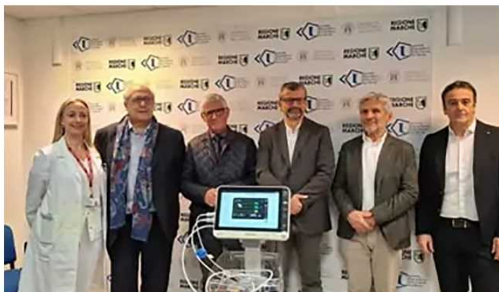
Fondazione Marco Mancini, il momento della donazione