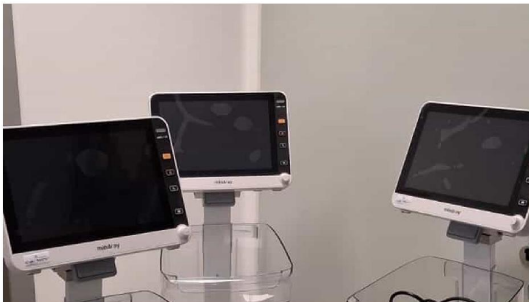
I tre monitor donati

A NCONA – Donati monitor multi-parametrici per il servizio di Endoscopia Digestiva dell'Azienda ospedaliero Universitaria delle Marche.