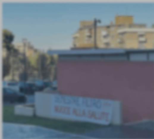
La facoltà di Medicina di Torrette. In alto: il polo di Torrette, al polo di Torrette.

ANCONA Fuori dalla Facoltà di Medicina di Torrette, al polo di Torrette, c'è un grande edificio in vetro. Segue l'ingresso con un'architettura moderna e una grande scala d'ingresso. «Il secondo appello non è stato superato», il preside Silvestrini ha detto. «Due mesi di lezioni non sono bastati». In 700 riprovano Fisica. Si temono le irregolarità. Il preside Silvestrini: «Qui da noi nessun intoppo».