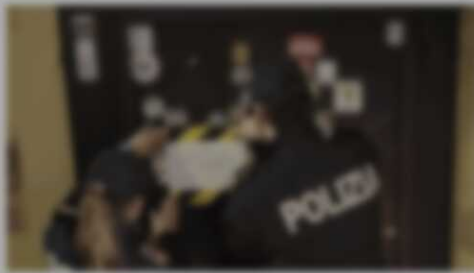
La polizia ha chiuso un circolo di soci che consumavano bevande alcoliche senza essere soci.

Una situazione di emergenza in grado di mettere in pericolo la vita di una persona è stata evitata a Ancona grazie al lavoro della Polizia e della Guardia di finanza che, dopo aver constatato che un gruppo di soci di un circolo aveva consumato bevande alcoliche senza essere soci, ha provveduto a sequestrare le bottiglie e a far uscire i soci dal locale. Sono alcuni dei motivi per cui la Polizia di Ancona ha dato precedenza al controllo dei locali dove si consumano bevande alcoliche senza essere soci. Sono alcuni dei motivi per cui la Polizia di Ancona ha dato precedenza al controllo dei locali dove si consumano bevande alcoliche senza essere soci.