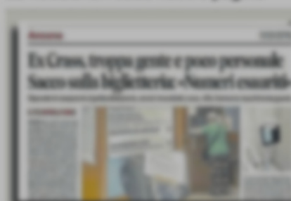
Fila lunghissima, disattivata la telemedicina

«L'azienda è stata una vera e propria... un'operazione culturale... serve un'operazione culturale... si può prenotare via App... Ma è già scontro politico...»